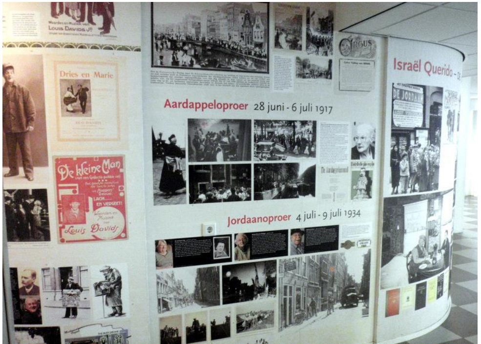
het Jordaanmuseum(pje) in verzorgingsthus "De Rietvink"

Na de koffie langs de buitensingel via de Rotterdamse brug naar het 1e Marnixplantsoen waar nog te zien is dat hier vroeger één van de 26 bolwerken in de stadsmuur was met op dit bolwerk een korenmolen.