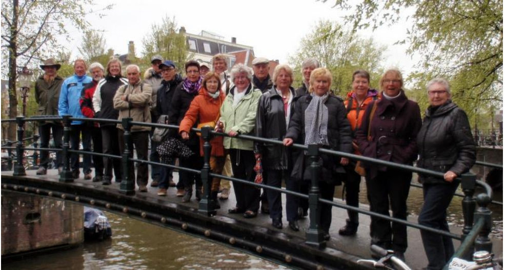
De wandelclub op het Melkmeisjesbruggetje

Het weer zat dan wel niet helemaal mee, het regende af en toe wat, maar dat mocht de pret niet drukken en met een gezelschap van 20 personen gingen we op weg voor een wandeling vanaf het Centraal Station over de Brouwersgracht met veel fraaie pakhuizen langs de plekken waar vanaf 1418 de vier achtereenvolgende Haarlemmerpoorten hebben gestaan en de laatste sinds 1840 nog steeds staat.