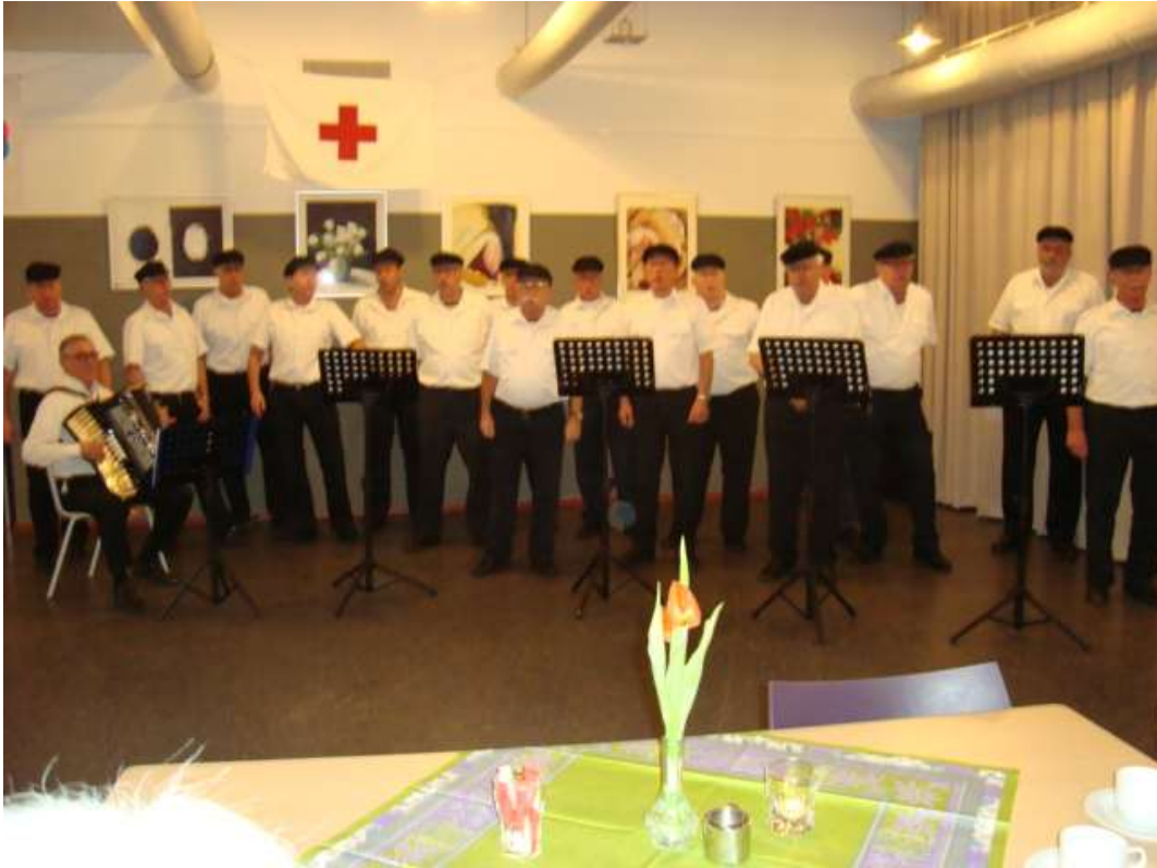
Een optreden van het Shanty koor