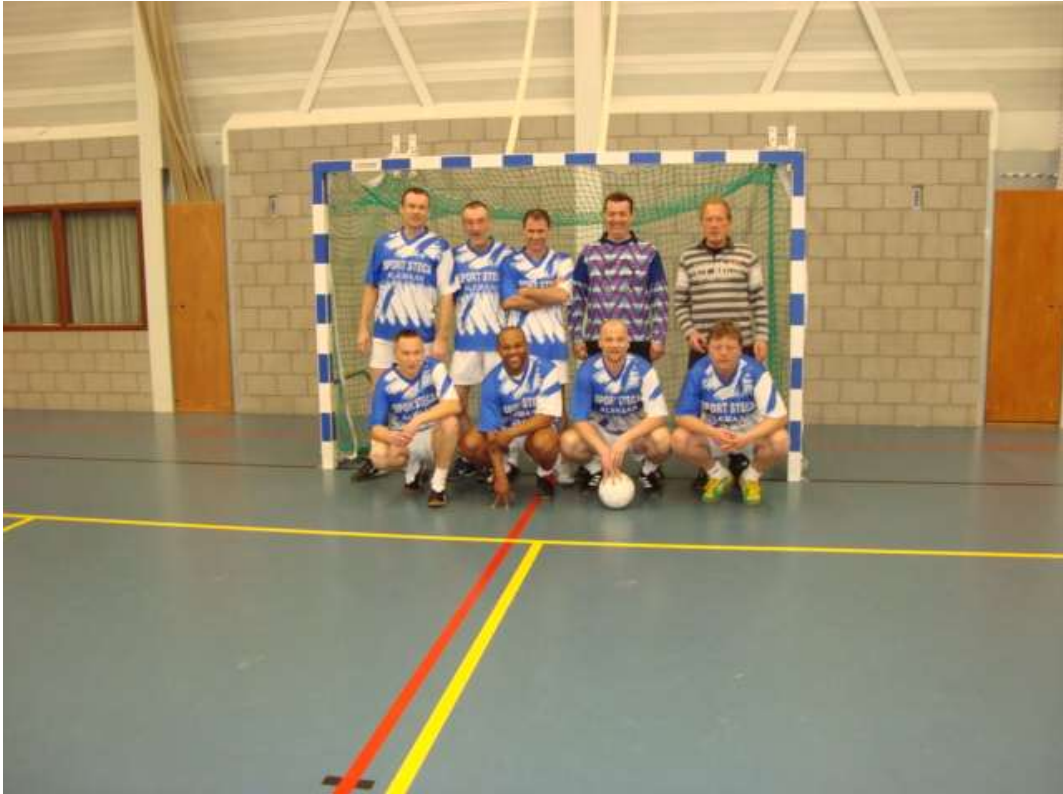
Het zaalvoetbalteam van de SOVA